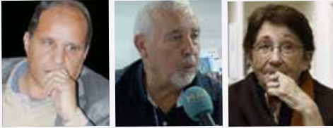
Table ronde 18.00 > 19.30 Salle Marrakech