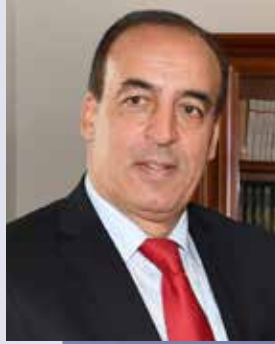
الحسن عيابة وزير الثقافة والشباب والرياضة، الناطق الرسمي باسم الحكومة

إلى جانب فعاليات ضيف الشرف، سيشارك في المعرض أكثر من 700 عارض، مباشر وغير مباشر، يمثلون أكثر من 40 بلداً، عرضاً أرسدة وثائقية من الكتب والمنشورات تجعل المعرض فضاءً لتعزيز صلات أوسع لجمهور القراء بعوالم النشر والكتاب والقراءة، ومناسبة لإبراز الجاذبية الدولية للمعرض الدولي للنشر والكتاب بالدار البيضاء بين معارض الكتاب في العالم.